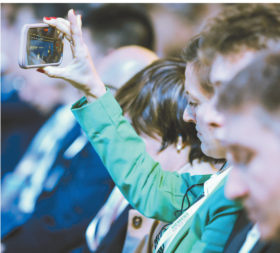
↑ 在全球绿色航运大会现场，嘉宾在仔细听讲。 ◆ 集装箱货轮在海南洋浦国际集装箱码头装卸货物。