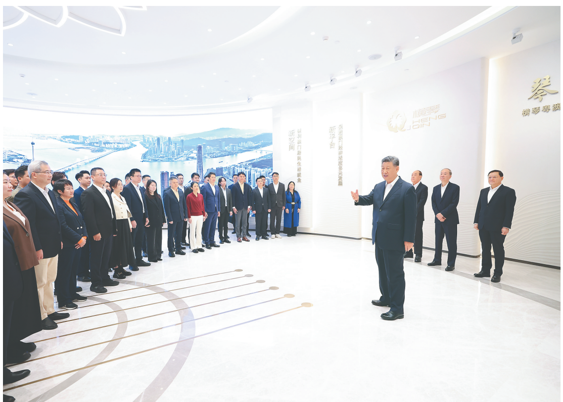
十二月十九日上午，中共中央总书记、国家主席、中央军委主席习近平在澳门特别行政区行政长官贺一诚陪同下，来到横琴粤澳深度合作区考察。这是习近平在横琴天沐琴台展示厅考察时，同参与横琴粤澳深度合作区规划、建设、管理、服务等各方面代表亲切交流。

新华社澳门12月19日电（记者朱基钗 杨依军 张研）19日上午，中共中央总书记、国家主席、中央军委主席习近平在澳门特别行政区行政长官贺一诚陪同下，来到横琴粤澳深度合作区考察。横琴地处广东珠海南端，与澳门一水之隔，是促进澳门经济适度多元发展的重要平台。党的十八大以来，习近平总书记多次考察横琴，为横琴发展把舵定向。2021年9月，党中央、国务院发布《横琴粤澳深度合作区建设总体方案》，为合作区建设擘画美好蓝图。在横琴天沐琴台展示厅，习近平参观“琴澳和鸣——横琴粤澳深度合作区建设主题展”。展厅里，一张张照片、一幅幅图表、一件件实物模型，生动直观展现了琴澳一体化发展情况和近年来粤澳深度合作取得的阶段性成果，习近平不时驻足察看，询问有关情况。习近平表示，横琴粤澳深度合作区成立3年多来，各项工作取得了积极进展，琴澳一体化水平逐步提升，对澳门经济适度多元发展的支撑作用日益彰显。