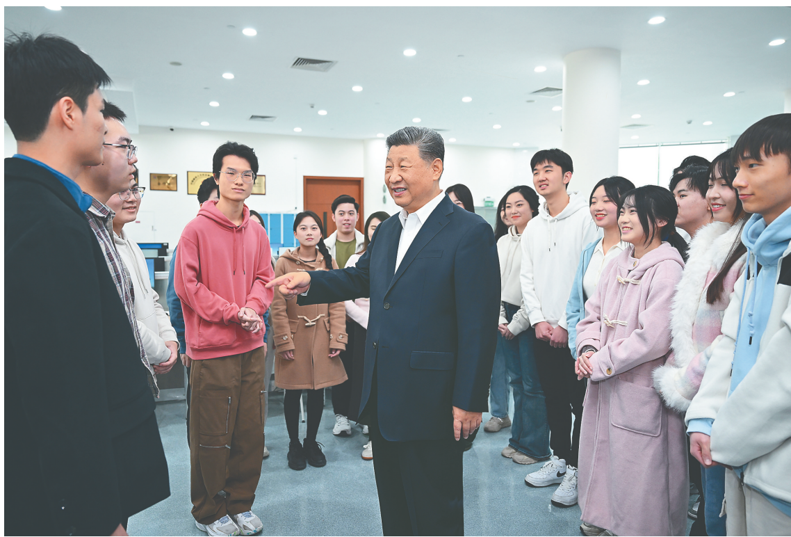
十二月十九日上午，国家主席习近平在澳门特别行政区行政长官贺一诚陪同下，来到澳门科技大学考察，同学校师生和科研工作者亲切交流。这是习近平在学校图书馆同正在查阅资料的同学们亲切交流。

新华社澳门12月19日电（记者朱基钗 杨依军 赵博）19日上午，国家主席习近平在澳门特别行政区行政长官贺一诚陪同下，来到澳门科技大学考察，同学校师生和科研工作者亲切交流。澳门科技大学是澳门回归祖国后成立的一所年轻大学，紧贴澳门和国家发展所需，注重发展特色与优势研究领域，已成为澳门学生规模最大的综合性大学。习近平来到综合教学大楼，详细了解学校和澳门高等教育发展情况，对澳门坚持教育服务经济社会发展，推进“教育兴澳、人才建澳”的成绩表示肯定。习近平听取中药质量研究、月球与行星科学国家重点实验室情况介绍，了解最新科研成果。他表示，中医药是中华文明的瑰宝，传承创新发展中医药是件大事。要把这一祖先留给我们的宝贵财富继承好、发展好、利用好，推动中医药走向世界。探月工程成果凝结着我国几代航天人的智慧和心血，从一个侧面展示了我们这些年在科技自立自强上取得的显著成就。你们的工作证明，澳门是能够做高精尖、国际一流科学研究的。