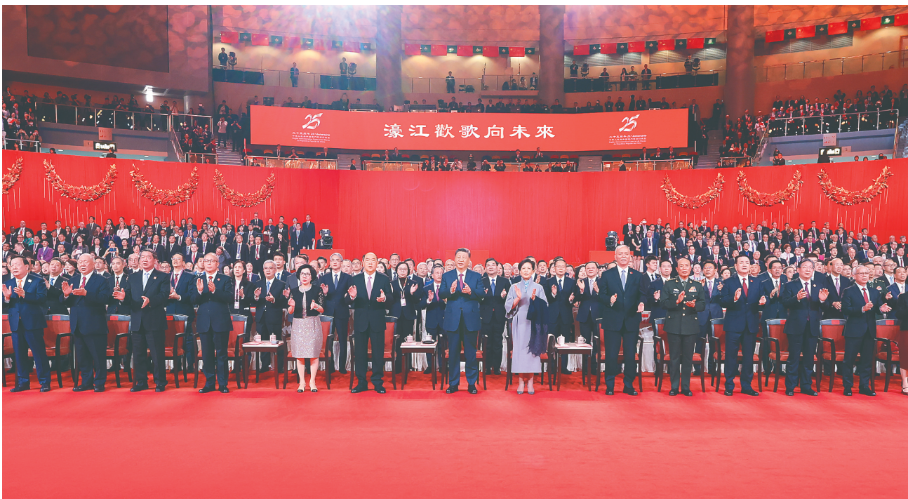
12月19日晚，庆祝澳门回归祖国25周年文艺晚会在澳门东亚运动会体育馆举行。中共中央总书记、国家主席、中央军委主席习近平观看演出。晚会最后，习近平同全场观众一起高唱《歌唱祖国》。

新华社澳门12月19日电（记者赵博 张研）镜海扬帆帆正劲，濠江欢歌向未来。庆祝澳门回归祖国25周年文艺晚会19日晚在澳门东亚运动会体育馆举行。中共中央总书记、国家主席、中央军委主席习近平观看了演出。演出现场灯光璀璨，欢乐喜庆。舞台上金莲花绚丽绽放，《我和我的祖国》、《今夜无眠》乐曲奏响。在《七子之歌》的深情旋律中， 下转A02版