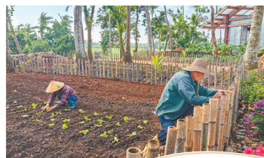
澄迈那雅村村民在庭院内种菜。

“乡村振兴的路还长，敦茶村要稳扎稳打地走下去。”冯善祥说，村里即将投产的咖啡加工厂和凤梨分拣专线，将让乡村振兴的“家底”更厚的同时，也可为村民增添一份有温度的保障。