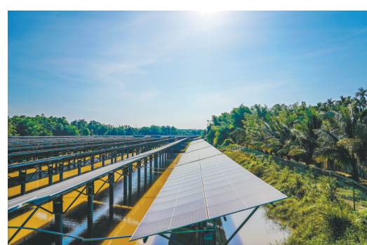
澄迈塘北村光伏产业振兴项目村外分布式项目。