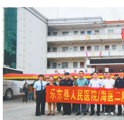
「办实事 送健康」巡回义诊活动开展

模式，今年以来，甄选31名管理、医疗及护理业务骨干下沉到各乡镇卫生院开展工作，帮助分院开展多项新技术、新项目，组织开展医疗质量管理、操作技能等培训249次；逐步建立医学影像等医疗服务共享机制，截至11月30日，该院诊