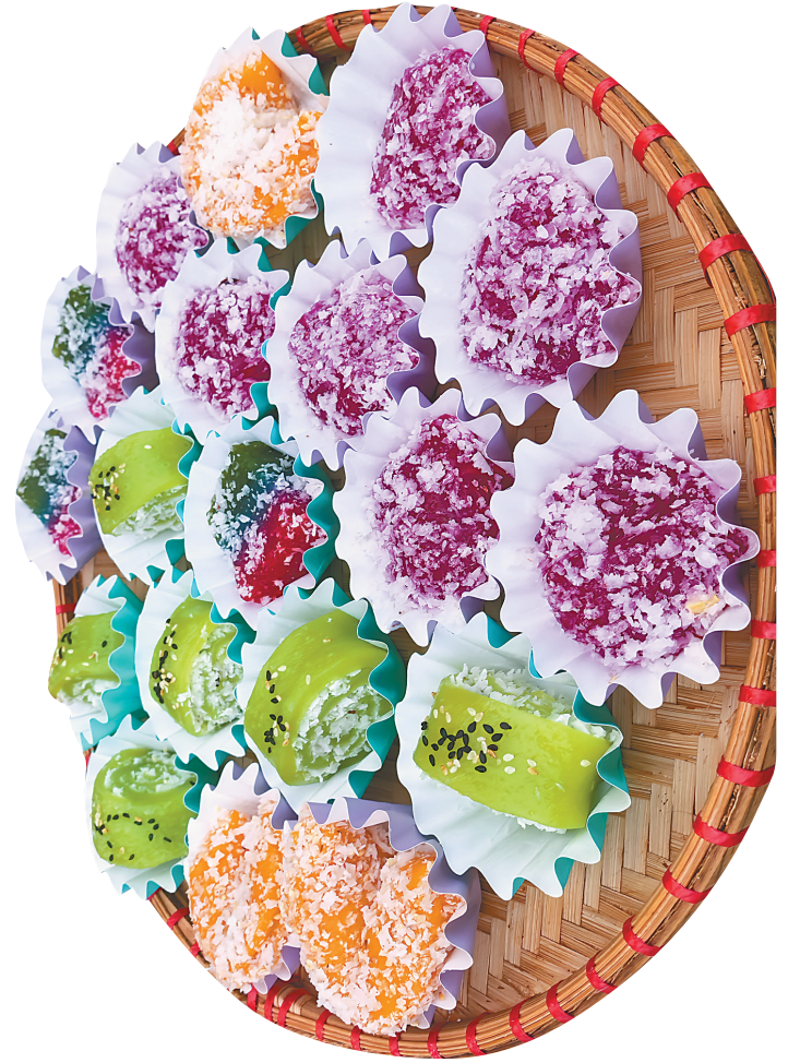
特色美食补给站提供琼海杂粮等美食。

这处补给站与常规补给站相连，3个长长的展台上，依此摆放着各种琼海特色美食。正中间的展台，摆放着多个保温自助烹饪站，其中橙黄色调的酱烧温泉鹅，早已被切块，方便跑友们品尝。一旁的跑友们传来阵阵赞叹声。