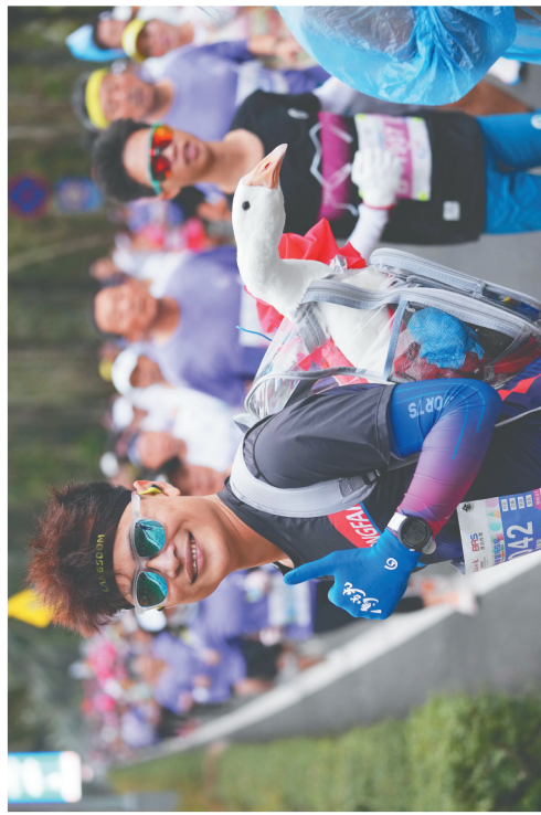
跑者们为选手们加油助威。

琼海市委副书记、市长李强表示，琼海将坚持以人民为中心的发展思想，持续加大文化投入，推动文化事业和文化产业繁荣发展。通过举办各种文化活动和赛事，琼海将努力打造成为一个充满活力和魅力的旅游城市。