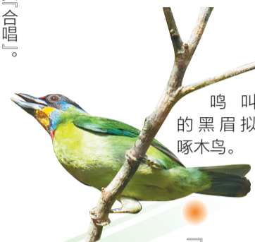
鸣叫的黑眉拟啄木鸟。