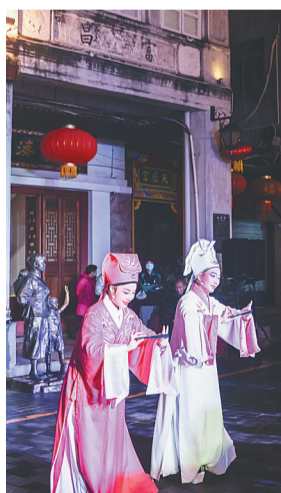
两位演员在海口骑楼老街表演琼剧。