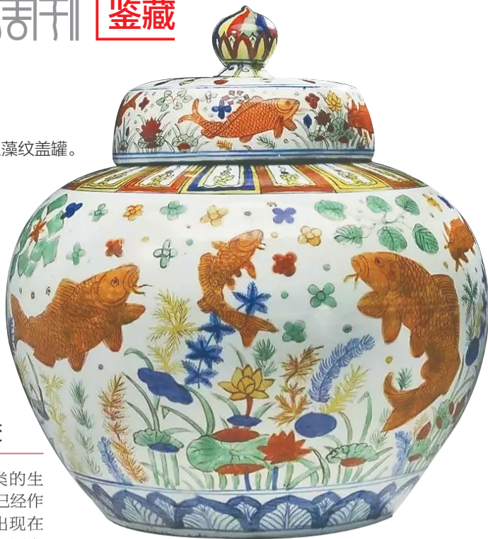
明嘉靖五彩鱼藻纹盖罐。