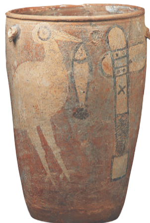
新石器时代的鹳鱼石斧图彩陶缸。