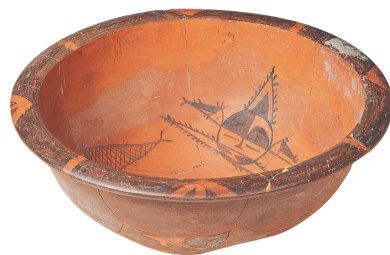
新石器时代的人面鱼纹彩陶盆。

元代匠人开始以毛笔在光滑的陶瓷上绘制鱼纹，多使用釉下青花和彩色釉料。这些鱼纹更为生动，背景常伴有水藻、莲花等，增加了画面的趣味性和层次感。明清是中国瓷器发展的鼎盛期，也是鱼纹装饰艺术的高峰。明代鱼纹瓷器种类丰富，具有浓郁的时代气息，其中青花鱼纹瓷器最具特色。永乐、宣德时期被誉为青花瓷器史上的黄金时代，这一时期鱼纹的色调呈现出幽深、艳丽的特点。清代的鱼纹装饰不仅延续了之前的优秀传统，而且在品种、数量、组合等方面有所突破。据记载，故宫博物院收藏康熙、雍正、乾隆时期的鱼纹瓷器分别是90、41、36件，可见这一时期鱼纹应用之广。