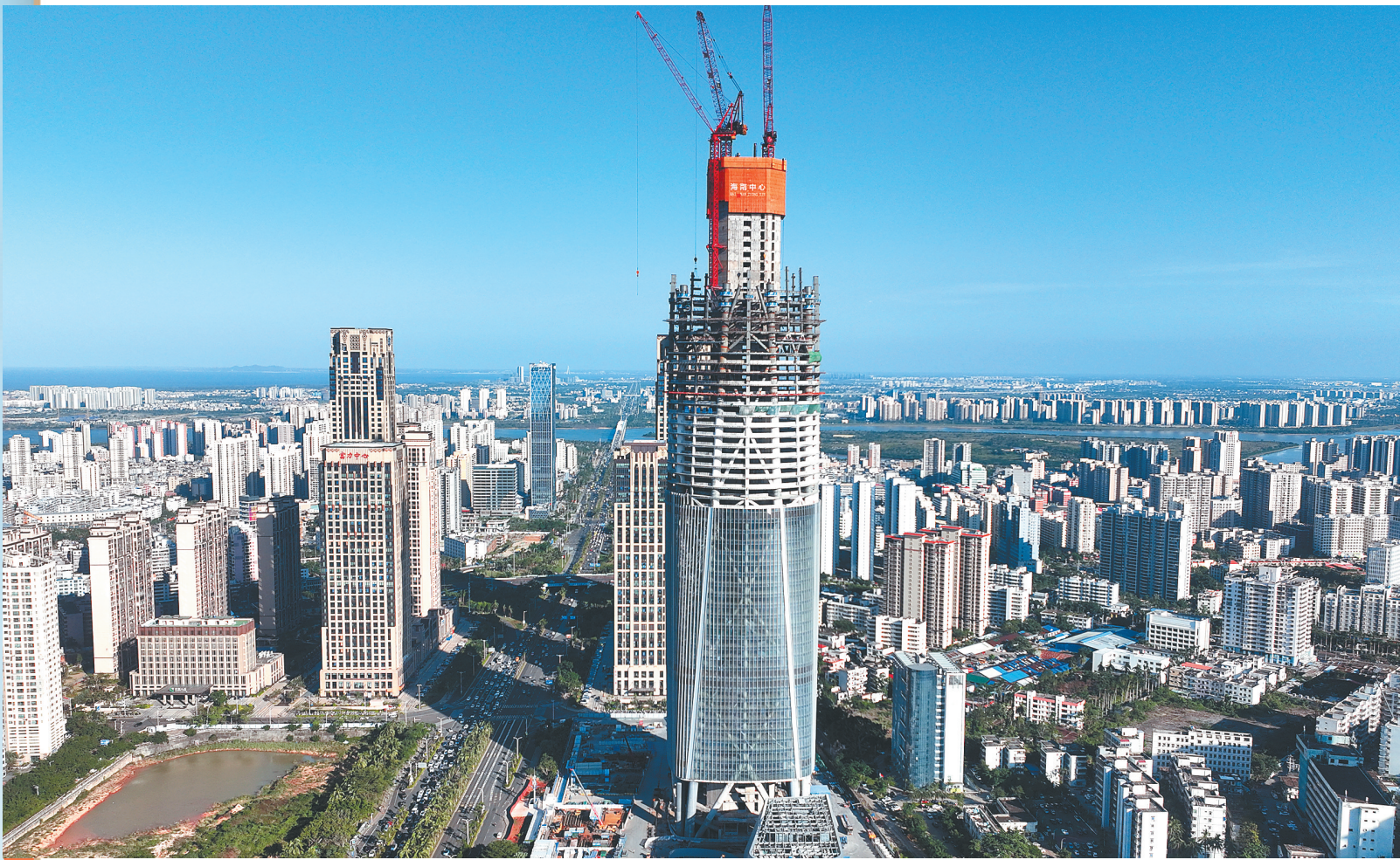
海南中心项目建设高度已达282米，奋力打造自贸港国内国际双循环交汇点的重要窗口。

资产总额增长到2216.8亿元，年均增长率25.7%，成为全省资产规模最大的省属国企；近三年营业收入连续跨越100亿元、300亿元大关，预计今年将突破500亿元；集团控股子公司超500家；新增4家公众公司，总量达到5家，总市值近700亿元……海南控股从资产百亿级的“小舢板”成长为千亿级“航母”，实现了综合实力的重大跨越。