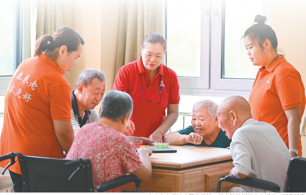
老人们在天津市西青区第一养老院的棋牌室内活动。