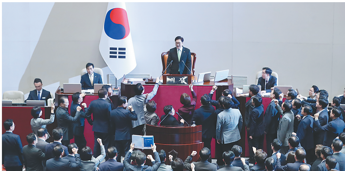
12月27日,韩国执政党国民力量党议员向国会议长禹元植(上中)抗议国会代行总统职权的国务总理韩德洙的弹劾动议案进行表决。

此前,宪法法院多次以电子邮件、派专人递送、邮寄等方式,向尹锡悦方面发送弹劾案审理相关通知文件,但均被拒收。尹锡悦还两次拒绝“共同调查本部”要求其到案接受调查的传唤通知。