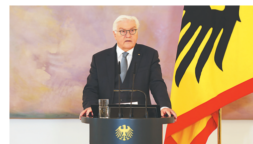
12月27日,德国联邦总统施泰因迈尔在新闻发布会上讲话。

据新华社柏林12月27日电(记者邵思聪 李超)德国联邦总统施泰因迈尔27日在柏林宣布解散联邦议院(议会下院),并计划于明年2月23日举行新一届联邦议院选举,以确定新任德国总理人选。