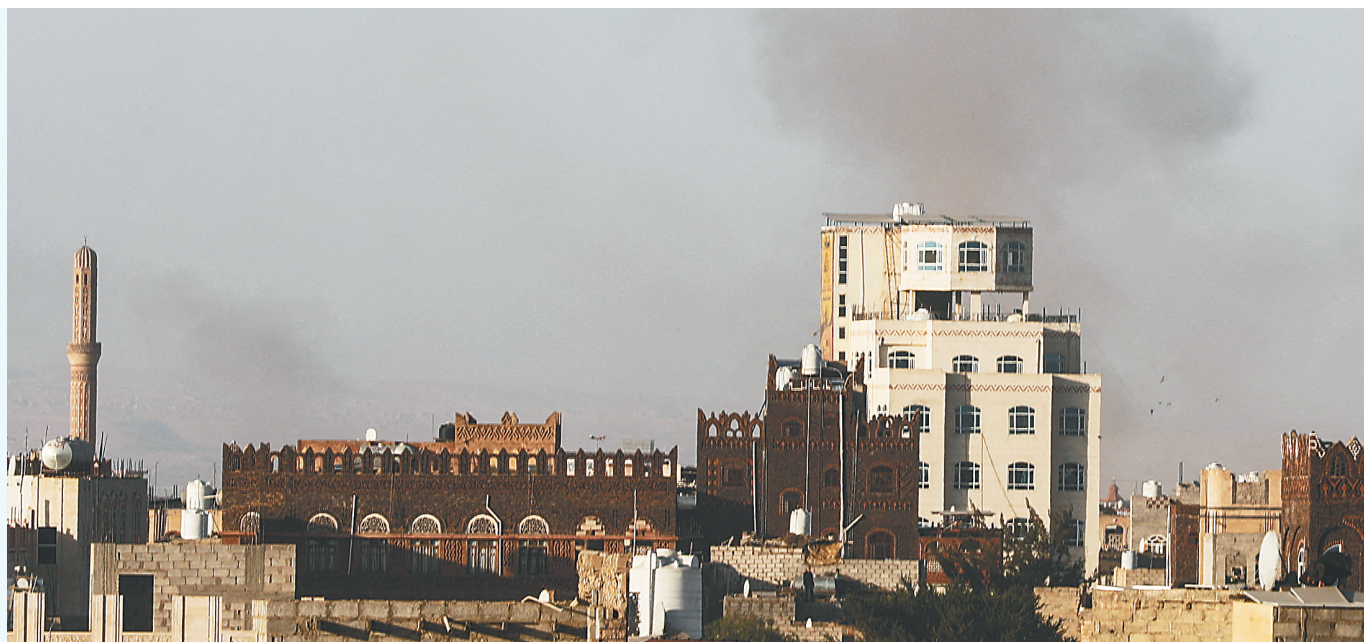
12月26日,也门首都萨那国际机场附近在以色列空袭后冒出黑烟。