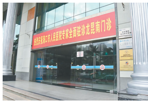
海口市人民医院专家全面进驻该院龙昆南门诊。