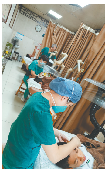
海口市人民医院龙昆南门诊的医护人员在为患者进行中医诊疗。

“新质生产力”，起点是“新”，关键在“质”，落脚于“生产力”。海口市人民医院创新一院多区一体化运营管理模式，将优质医疗资源的触角延伸至老百姓家门口，创新医疗人才培养、服务创新等关键领域，有效推动医疗技术创新和医疗服务水平的提升，全面增强人民群众就医获得感。