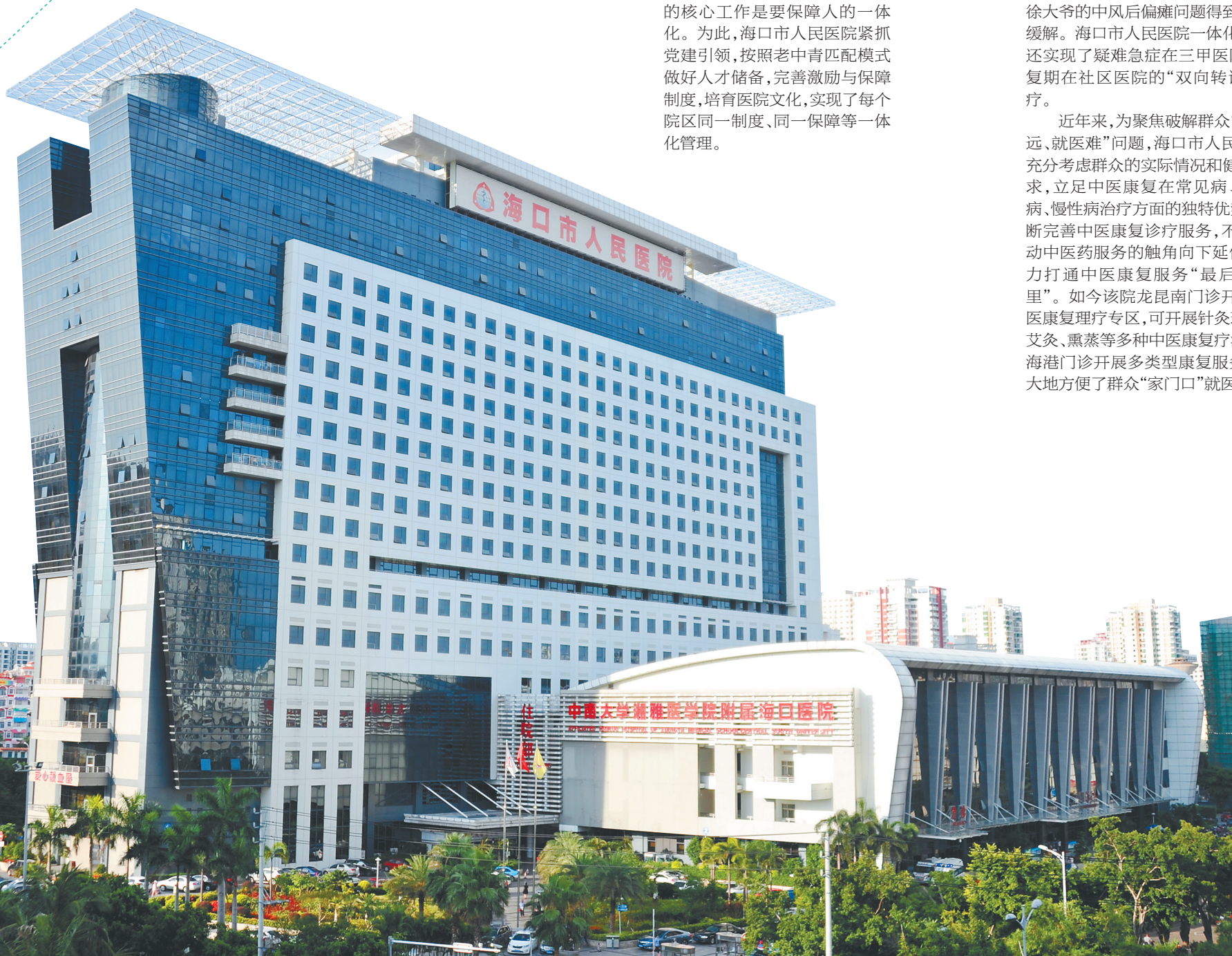
海口市人民医院门诊与住院大楼。