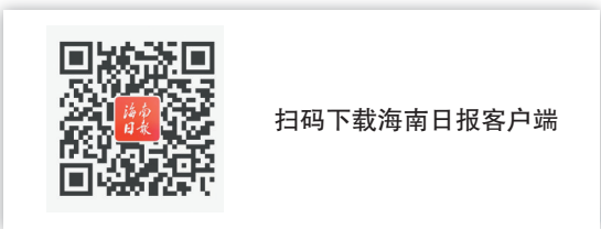
扫码下载海南日报客户端

目前，海南日报客户端6.0版已在各大手机应用市场上线，广大用户搜索“海南日报”即可下载安装。