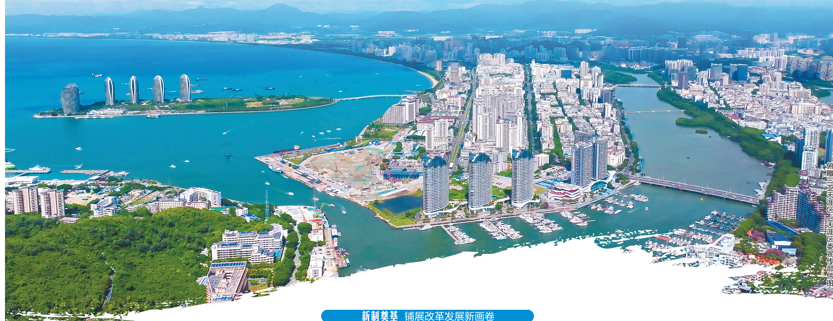
俯瞰三亚天涯区