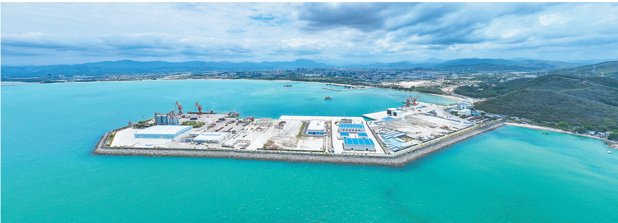
俯瞰三亚南山港公共科考码头。王将就 摄