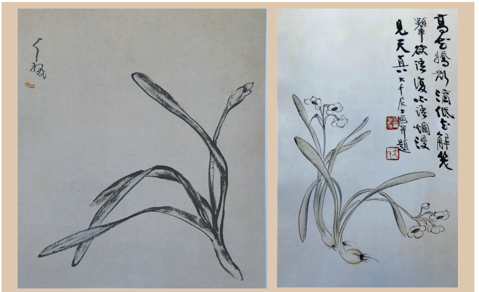
八大山人的《水仙图》。 缪士毅供图 张大千的《水仙图》。 缪士毅供图

近现代画家齐白石笔下的花卉题材众多,水仙花是其中之一。他的一幅《水仙》画作,尺寸为870mm×470mm,创作于20世纪20年代中期,在这幅《水仙》画中,可见画面上水仙生机盎然,自然入妙,花茎直立,茎叶扶疏,花朵盛绽,黄冠白英,不避俗,却能脱俗。齐老用手中的神笔,将水仙生机勃勃之状描绘得淋漓尽致,生动逼真。而此画面中“水仙”左侧上方的题识:“前朝金冬心先生尝画水仙云:画此须得冷冰残雪态。言水仙之神,不能更增一词矣。白石山翁并记。”既流露了齐老从清代“扬州八怪”金农(号冬心先生)画水仙中得到感悟,又表达了对金农水仙画作的赞美之情。