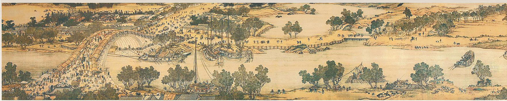
清院本《清明上河图》局部。