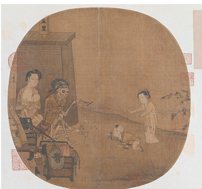
南宋李嵩的《骷髅幻戏图》。北京故宫博物院藏

在汴河两岸,除了豪华气派的大酒楼,更多的是供给劳苦市民阶层的小酒铺,竹棚柴门,简单的陈设着桌椅,兼卖点酒食,这里没有跑堂的堂倌,常见的就是夫妻二人,倾力经营。这些大大小小的酒店、酒肆,除了现钱交易外,还接受以物换酒、以物品抵押酒、凭信