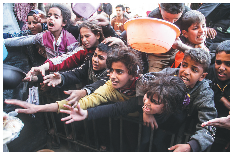
2024年12月23日,巴勒斯坦儿童在加沙城领取食物。