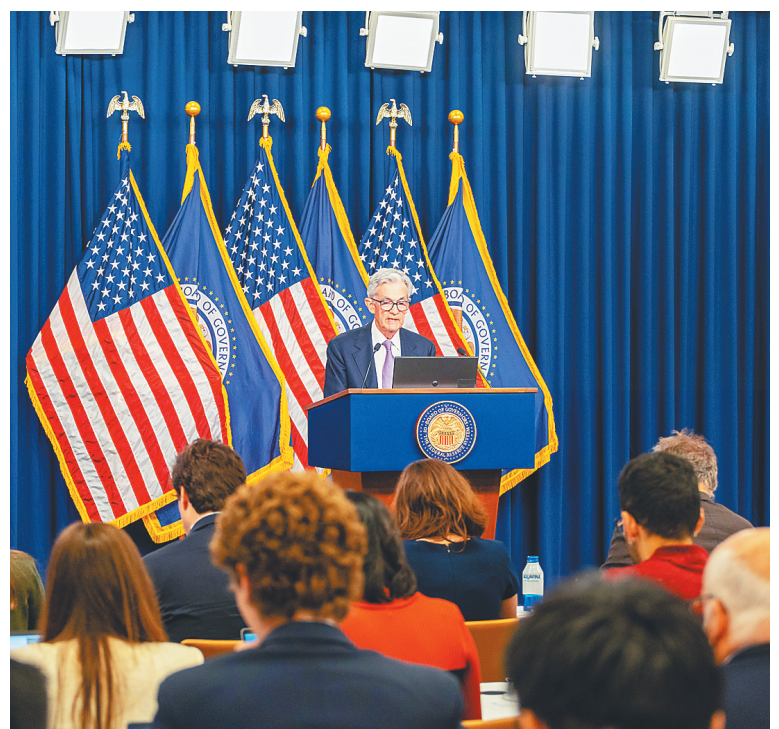
2024年9月18日,美国联邦储备委员会主席鲍威尔在华盛顿出席记者会。