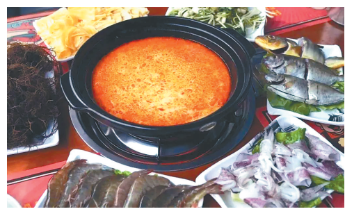
糟粕醋火锅。

海南渔获丰富，抢滩且活跃消费市场，鲜甜无疑是其锋芒。若有文昌糟粕醋倾力加持，一份海鲜火锅的灵魂，自然被激荡起来。