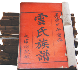
清光绪年间重修的云氏族谱。

2024年3月，“海南民间遗存珍稀族谱文本的收集、整理与海上丝绸之路人口迁徙路线研究”项目(以下简称研究项目)被列入国家社会科学基金“冷门绝学”研究专项，为海南族谱保护与研究提供了新的方向和思路。