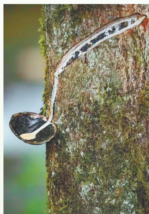
漆树流出生漆。本版图片均为资料图