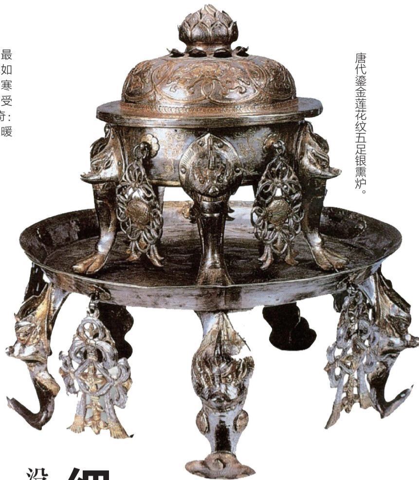
唐代鎏金莲花纹五足银熏炉。

类似暖阁的设施，其实早在战国时期就有了。上世纪七十年代，考古学家在秦国都城咸阳的宫殿遗址内发现了一间浴室，而这里又发现了我国历史上最早的壁炉。据描述，这一壁炉的长、宽、高均1米左右，炉身用土坯砌造，炉膛为覆瓮型，火墙是筒瓦扣成管道，砌于墙内，锅灶相通。这一设计可以让热气在炉膛内充分回旋，也便于炉烟迅速排出。为了方便使用，炉口前砌有灰坑，炉左侧为存放木炭的炭槽，以有效延长木炭燃烧时间，让室内始终温暖如春。如此一来，秦王洗澡时就不用怕冷了。