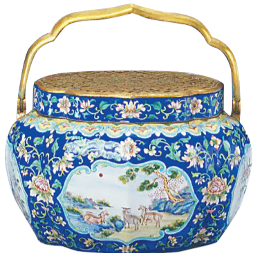
清 画珐琅三阳开泰纹手炉。 故宫博物院藏

岁末时分，寒风渐起，又到了一年中最新冷的时候。对现代人来说，各种取暖设施如暖气、空调、地热等应有尽有，即使外面天寒地冻、风雪交加，室内也总能暖意融融，不受冰冻之苦。正因为如此，很多人也会好奇：在生活条件落后的从前，古人又是如何取暖并度过冬季的漫漫寒夜的呢？