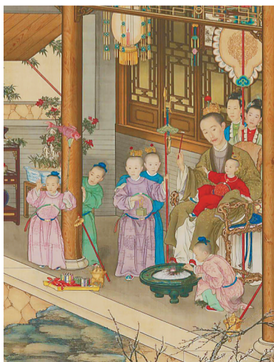
清《弘历雪景行乐图》。