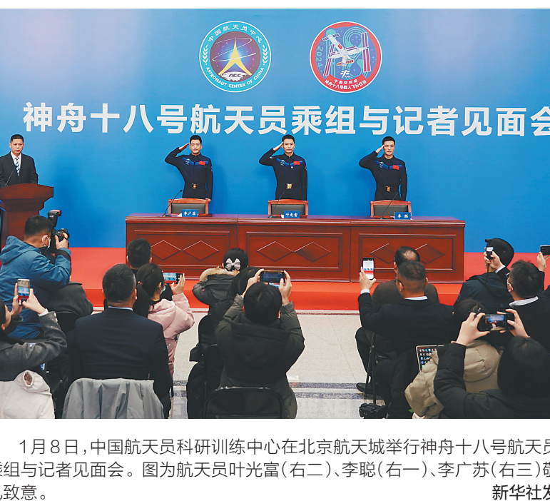
1月8日,中国航天员科研训练中心在北京航天城举行神舟十八号航天员乘组与记者见面会。图为航天员叶光富(右二)、李聪(右一)、李广苏(右三)敬礼致意。

目前,中心正按计划实施专项医学检查和实验数据采集,在完成健康评估总结后,3名航天员将转入正常训练工作。神十八乘组表示,能够为国出征,他们倍感荣幸和自豪,期待早日重返太空。