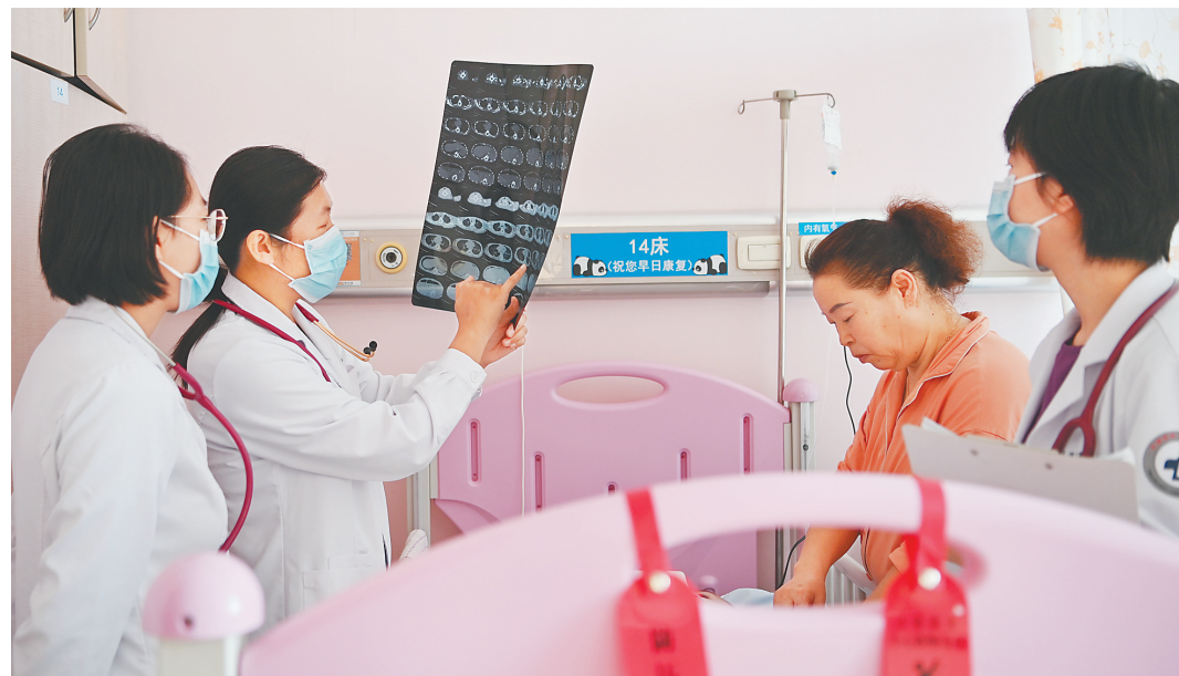
天津市第一中心医院儿科医生在病房查看患儿病情。

据介绍，近一年来常用的呼吸道疾病国产治疗药品没有出现断货情况，平台供应十分稳定。下一步，工信部将密切跟踪呼吸道疾病发展态势，加强生产监测和供需对接，及时响应市场需求。