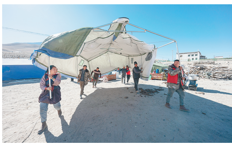
在定结县郭加乡乃村集中安置点，村民和志愿者在搬运帐篷。