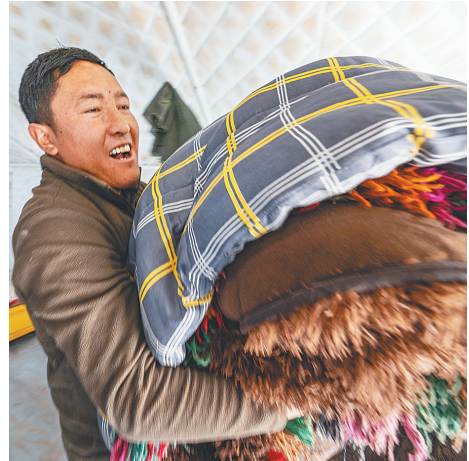
在定结县郭加乡乃村集中安置点，村民在搬家。