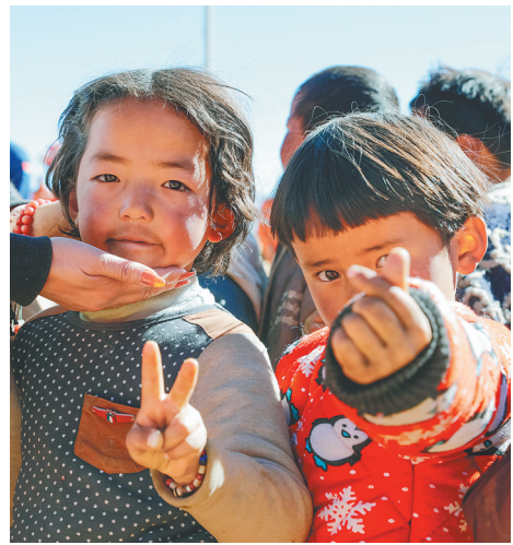
在定日县措果乡措昂村的受灾群众安置点，孩子们排队领午餐。

信心与希望，正在雪域高原汇聚。（新华社拉萨1月12日电 记者林建扬 周圆 李华）