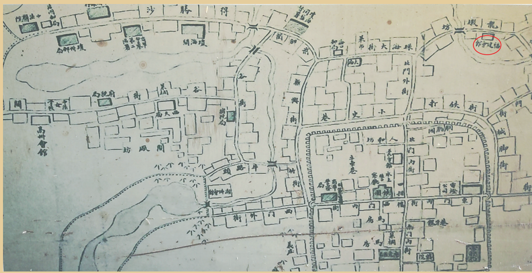
《清朝海口所城范围图》，红圈处即福建会馆所在地。