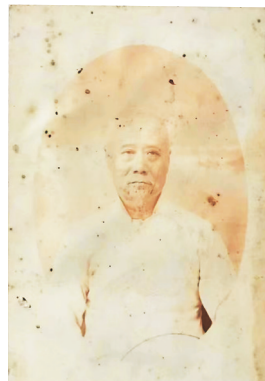
粘世昭（号璞斋）像。