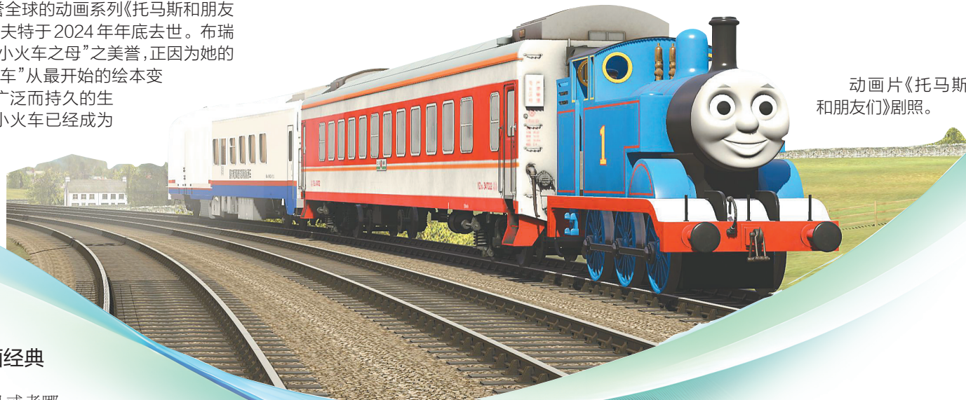
动画片《托马斯和朋友们》剧照。

据相关媒体报道,享誉全球的动画系列《托马斯和朋友们》的主创布瑞特·奥克罗夫特于2024年年底去世。布瑞特·奥克罗夫特有“托马斯小火车之母”之美誉,正因为她的努力,才使得“托马斯小火车”从最开始的绘本变成荧屏形象,从而获得更广泛而持久的生命力。时至今日,托马斯小火车已经成为几代人的集体记忆。