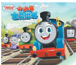
动画里的主角托马斯小火车运行了近600集。