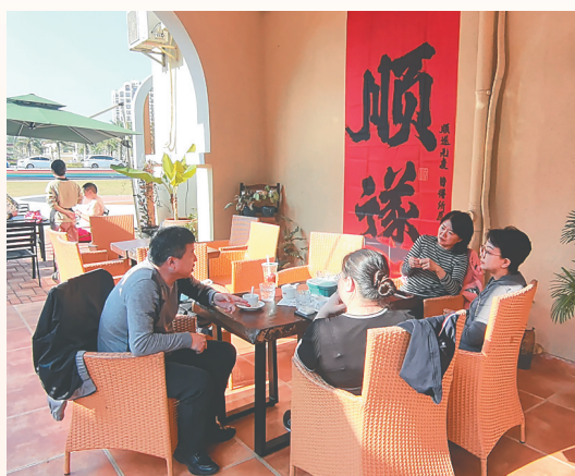
1月19日,游客在福山咖啡文化风情小镇享受悠闲时光。