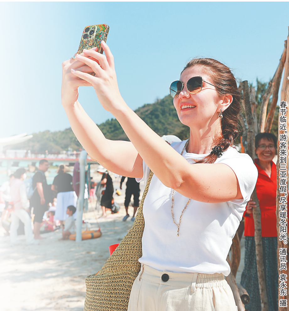
春节临近,游客来到三亚度假,尽享暖阳阳光。