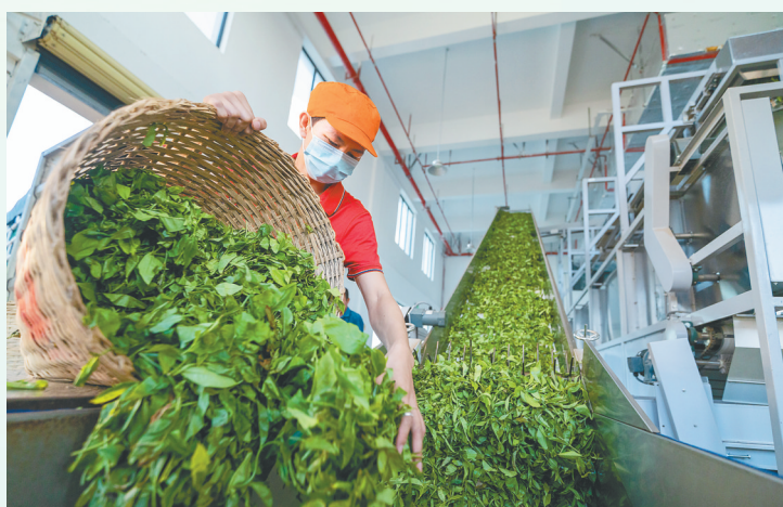
琼中黎族苗族自治县海岭镇,海垦乌石茶业公司生产车间工人在忙着制茶。