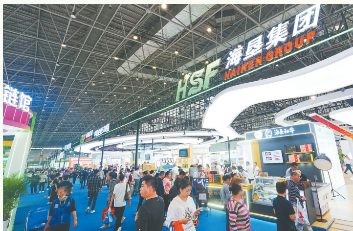
2024年海南冬交会海垦集团展馆。

蓄势“开门红”,奏响“春之曲”。今年,海垦集团一方面将持续树牢“项目为王”鲜明导向,抢抓“两重”“两新”和提振消费专项行动等政策机遇,谋划实施一批重大项目;另一方面深化垦地融合,推进垦区基础配套和公共服务体系开好局、起好步。 从春天启程,海垦集团上下放下干劲,开拓进取,拿出“开局就是决胜”的使命感,增强“起步就是冲刺”的精气神,以狠抓落实促发展,把“起势”转化为“定势”“胜势”,推动海南农垦高质量发展和农业现代化建设的热情如春潮澎湃。 (本报三亚1月25日电)