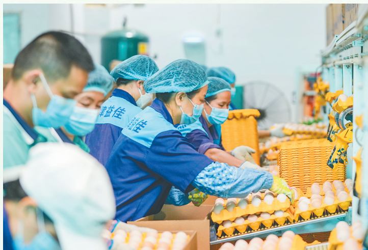
海南农垦海津益佳鸡蛋厂,工作人员在生产线上忙碌。