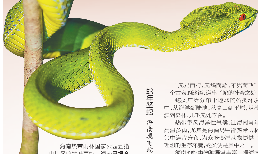
海南热带雨林国家公园五指山片区的竹叶青蛇。