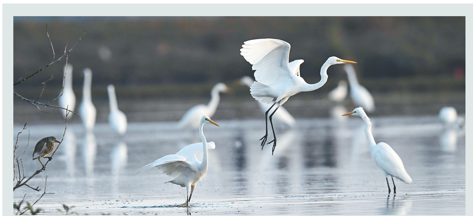
↑↓在儋州湾栖息的候鸟。

按计划,白沙将于2月11日至24日每天发放314张消费券,2月25日发放310张消费券。消费券按优惠力度分为6档,活动期间,所有白沙个人消费者(含外地来白沙人员)均可于每日9时起扫码打开“椰岛全民荟”小程序,点击“兴商惠民·乐享白沙”页面领取消费券,每档限领一张,先到先得。群众凭获得的消费券在活动商家处出示微信支付码进行消费,可享消费券等值金额减免优惠。