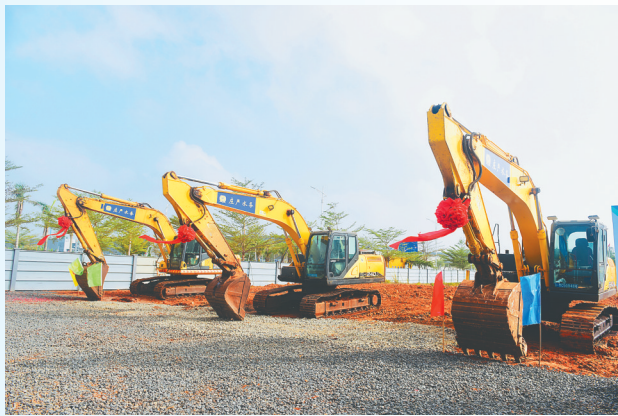
2月17日，澄迈县2025年第一批项目集中开工。

展望2025年，澄迈将继续运用“1443”工作法，以“五大攻坚战”推动“四个澄迈”(青年澄迈、文化澄迈、数智澄迈、幸福澄迈)建设，谋划实施一批打基础、增后劲、添活力、惠民生、补短板的高质量项目，并以更实举措持续推进重点项目建设落地见效，以项目建设之“进”支撑高质量发展之“稳”，为实现“五大攻坚战”不断蓄势赋能。(本报金江2月17日电)