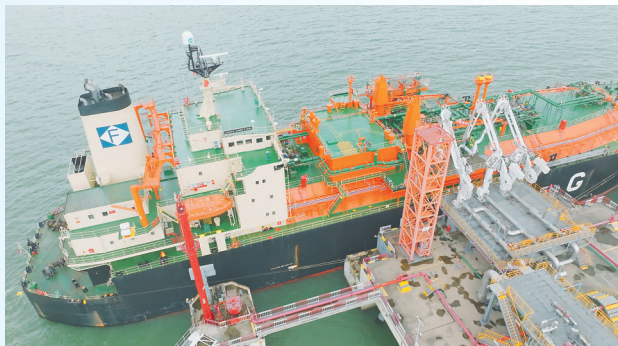
中国石油天然气销售海南公司所属能源公司澄迈LNG储备库码头。(资料图)