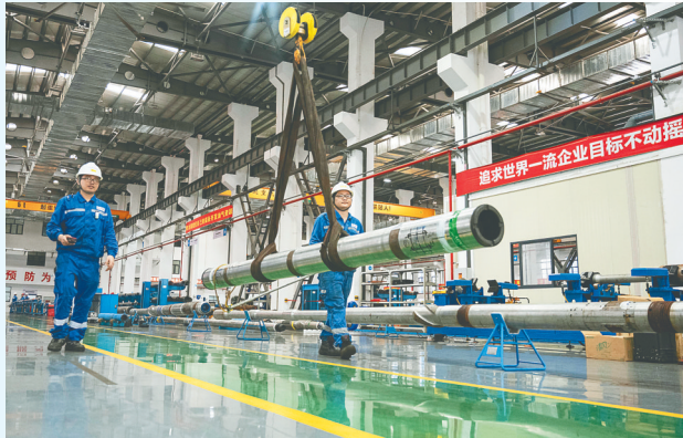
位于澄迈的海南省深海深层能源工程重点实验室内，工程师在进行设备维修和保养。(资料图)