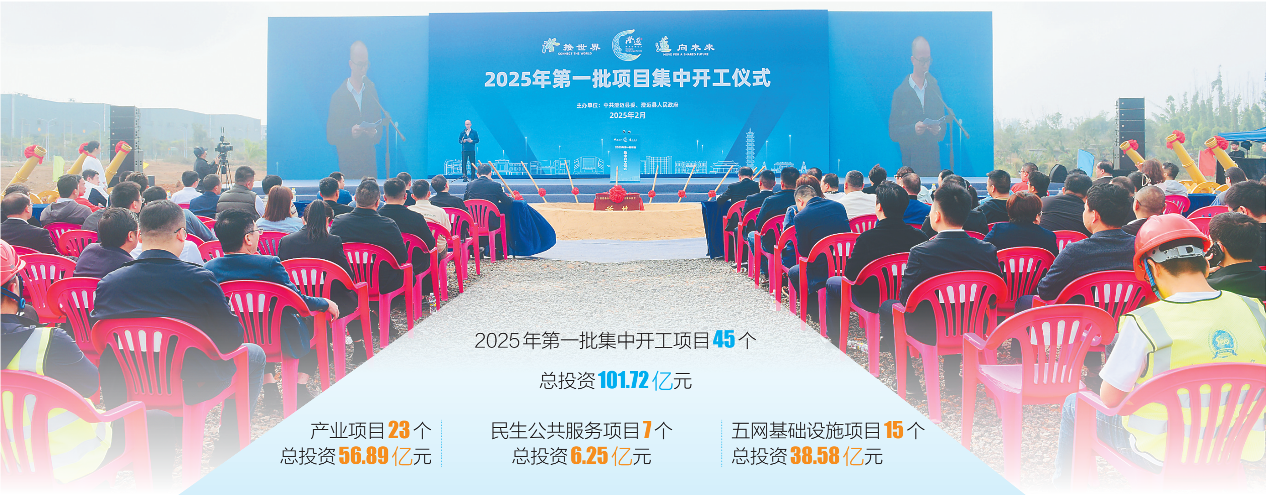
二月十七日，澄迈县举行二〇二五年第一批项目集中开工仪式。