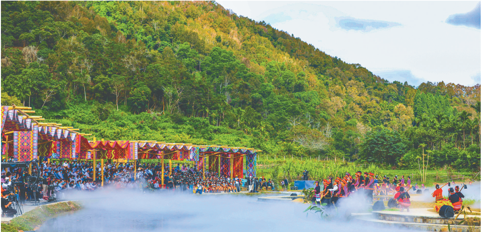
五指山毛纳村。