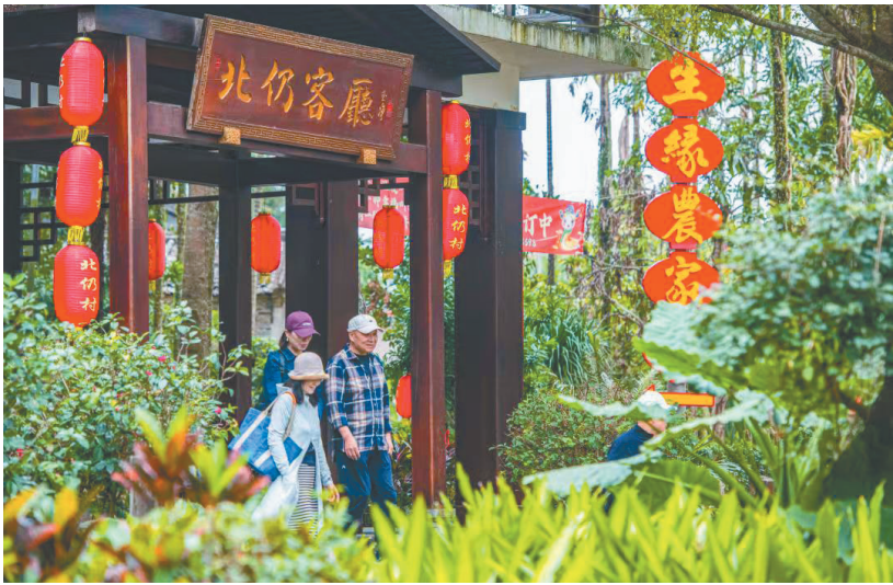
琼海北仍村。蒙钟德 摄