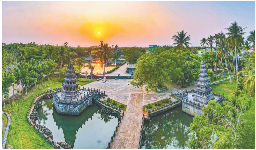
澄迈美榔村。