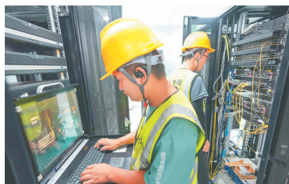
洋浦港封关项目现场,工作人员在调试设备。