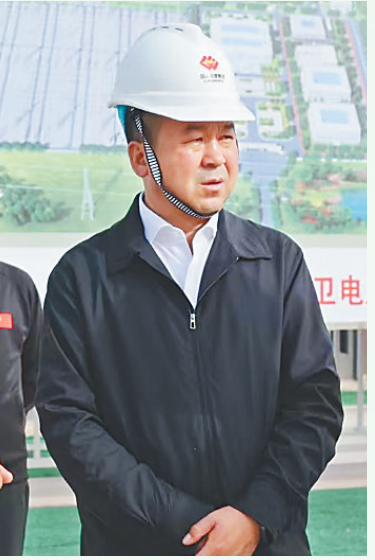
全国人大代表、宁夏中卫市委副书记、市长马洪海。

在新能源赛道上，以技术创新为支点，撬动产业升级的同时，储能产业的崛起成为另一亮点。从风光电站配套储能系统到独立储能电站示范项目，中卫市通过政策引导和市场驱动，吸引了国内头部储能企业入驻。宁夏中车新能源有限公司的