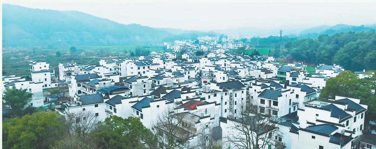
婺源石口村一隅

“今年，我们将围绕健全生态产品动态监测机制、拓展市场交易易场、做大金融投融资规模、创新经营开发机制等方面，推进‘两山’加速转化。”江西省发展改革委相关负责人表示。