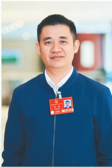
全国人大代表、海南五指山市水满乡党委书记林豪。

旅游人气带来了收入财气，村民们在家门口卖起茶叶，开起农家乐，吃上了“旅游饭”。据统计，2024年