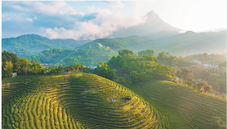
五指山水满乡茶园风光