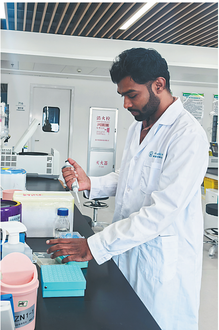
外籍科研人员在三亚崖州湾科技城实验室做实验。

3月10日，中国共产党三亚市第八届委员会第九次全体会议召开。会议进一步深化新时代新征程三亚现代化建设的部署，带领全市上下坚持以高质量发展为牵引，奋力谱写中国式现代化海南篇章三亚章节。如何绘就城市发展的路线图、施工图，是会议的重点，也是外界关注的热点。