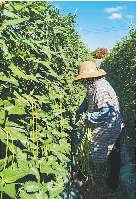
三亚崖州区农户在采摘纱帐红豆。本组图片均由海南日报全媒体记者黄媛艳摄