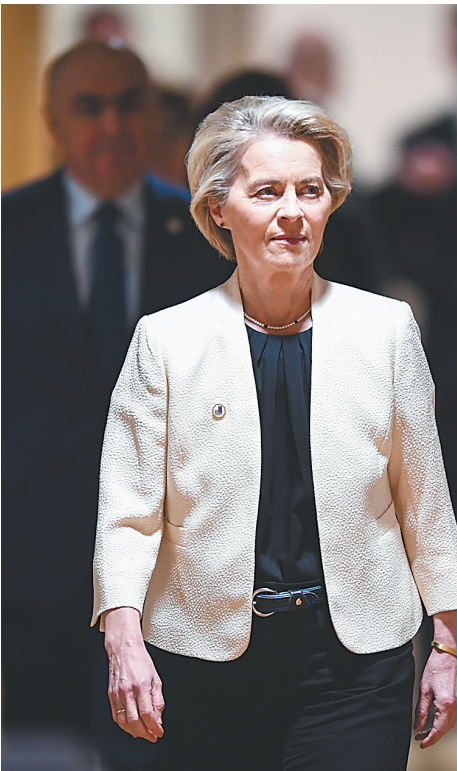
↑3月6日，在比利时布鲁塞尔，欧盟委员会主席冯德莱恩在欧盟特别峰会上。

复旦大学欧洲问题研究中心主任丁纯认为，当欧洲试图超越北约框架构建安全架构时，面临三重矛盾：在地缘政治层面，欧洲既想摆脱美国控制又不愿完全割舍对美安全依赖；在军事装备生产层面，欧洲军工产业链深度嵌入美国体系，要建立起独立和完善的军工体系面临不少困难；在意识形态层面，法德倡导的“多极化世界”与东欧国家坚持的“大西洋主义”存在温差。