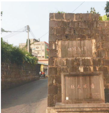
海口府城东门遗迹。