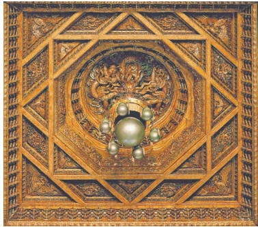
北京故宫太和殿藻井。