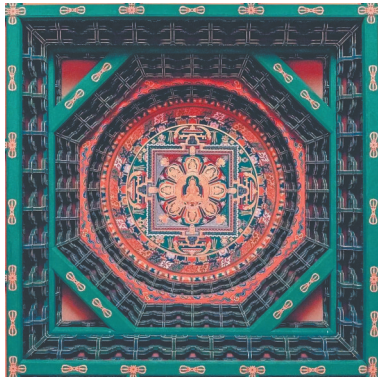
北京法海寺药师殿藻井。