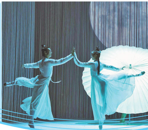
2024年芭蕾舞剧《白蛇传》剧照。