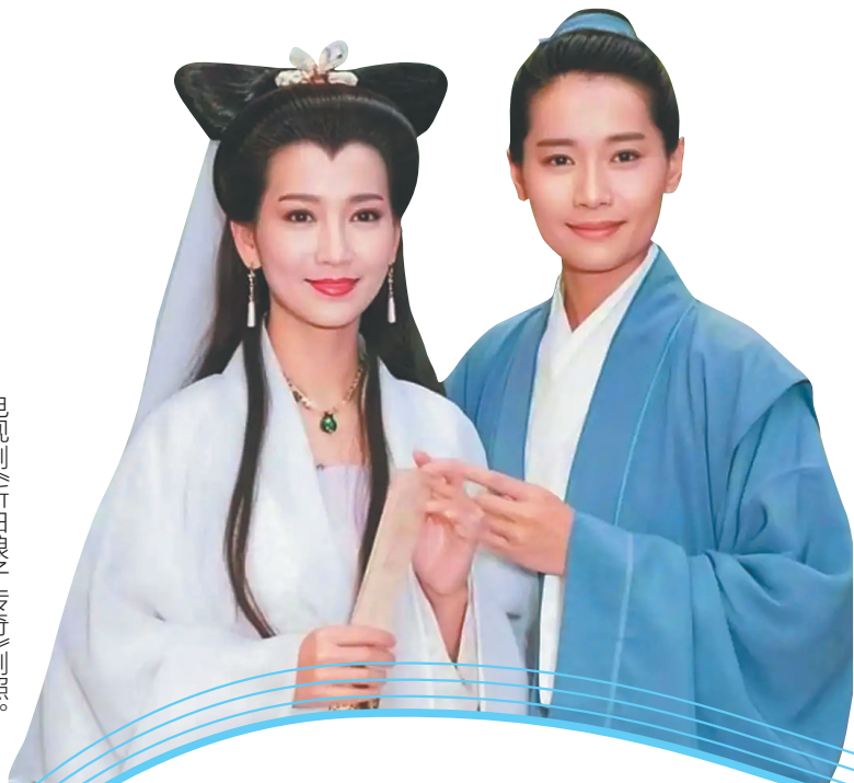
电视剧《新白娘子传奇》剧照。