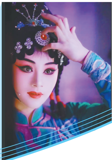
京剧《白蛇传》中的青蛇剧照。