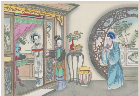
《白蛇传》年画册，天津荣宝斋印绘。

斗转星移，“白蛇传”的故事已经流传了千年，《白蛇传》的戏剧也在舞台上风靡了三百多年，而白娘子敢爱敢恨，勇敢反抗压迫、追求爱情的精神也将一代一代地永远流传下去。很多年后，也许还会有更多形式、更多版本的白蛇的故事出现，也将有更多的人会被这段爱情故事所感动。