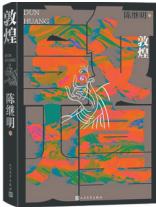
作者:陈继明 版本:人民文学出版社 时间:2024年7月

这是一部配得上敦煌气象的大作品,富有浓郁西部气息,原创力强劲,兼具历史的和美学的、民族的和人性的、知识的和趣味的特征。这里多民族聚居、人神丛聚、万物有灵;这里有西部的马、骆驼、羊、狼,有敦煌独有的颜色、虚空、佛法、天地。人人梦中的敦煌因此落地。