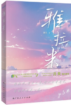
《雅拉米》 作者:吴贝 版本:广西人民出版社 时间:2024年11月

《雅拉米》通过海疏雨和吉墨云的爱情故事,向读者传递了爱与奉献这个永恒主题,在当今网络文学市场中算是一股清流。这种主题也让读者在阅读过程中获得了共鸣和思考。[图]