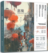
作者:简忠威 版本:西苑出版社 时间:2025年2月