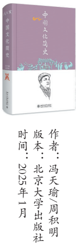
作者:冯天瑜、周积明 版本:北京大学出版社 时间:2025年1月

《中国哲学简史》《中国文化简史》堪称“双璧”,二书交相辉映,追寻中国之根。汇集中国文化研究成果的集大成之作,构建中国文化史的完整体系,是适合全民阅读的、不能替代的中国文化史普及精品。