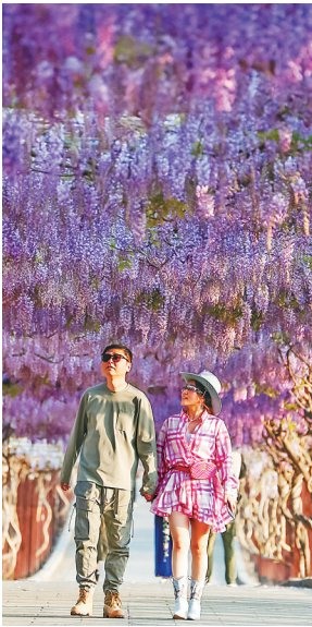
4月6日，游客在江苏省句容市后白镇张庙村赏花游玩。

《中国证券报》7日刊发文章《清明假期“流量”变增量 浓郁春意点亮文旅新意》。文章称，交通运输部4月5日发布的数据显示，今年清明假期首日(4月4日)，全社会跨区域人员流动量为2.87亿人次，较2024年同期增长9.7%。多个旅游平台数据显示，清明假期期间，短途周边游升温，“高铁+”出游受追捧，赏花游成“顶流”。