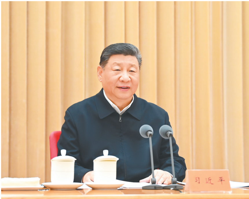
4月8日至9日,中央周边工作会议在北京举行。中共中央总书记、国家主席、中央军委主席习近平出席会议并发表重要讲话。

新华社北京4月9日电 中央周边工作会议4月8日至9日在北京举行。中共中央总书记、国家主席、中央军委主席习近平出席会议并发表重要讲话。中共中央政治局常委李强、赵乐际、王沪宁、蔡奇、丁薛祥、李希,国家副主席韩正出席会议。