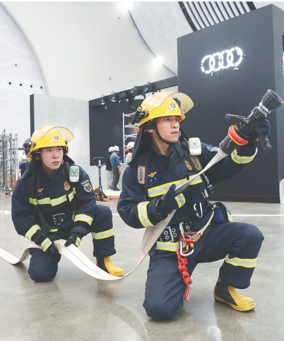
4月9日，海口市消防救援支队现场安保团队在海南国际会展中心举行消防演练。