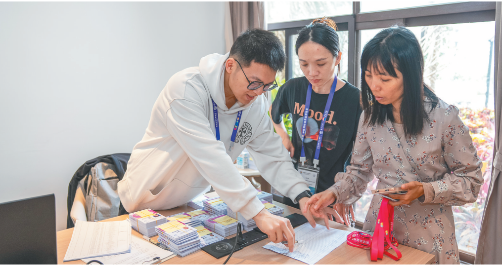
4月9日，海口良智海景大酒店，参加消博会的媒体记者领取证件及相关物料。

随着第五届中国国际消费品博览会的脚步日益临近，全球的目光将再次聚焦海南。连日来，有关部门积极行动，从展区布展、安保演练、服务保障等多个方面，为消博会的举办保驾护航。