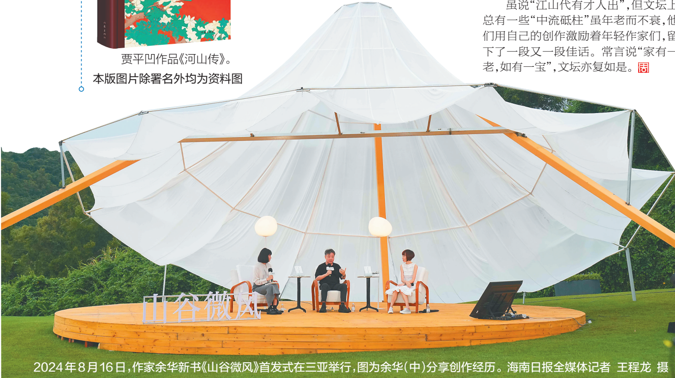
2024年8月16日,作家余华新书《山谷微风》首发式在三亚举行,图为余华(中)分享创作经历。