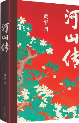
贾平凹作品《河山传》。