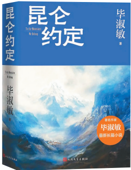
毕淑敏作品《昆仑约定》。