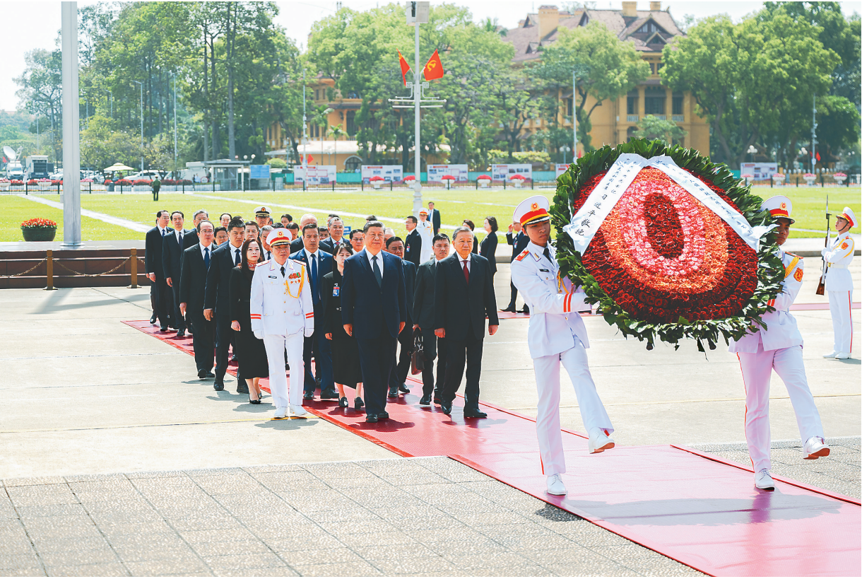
四月十五日上午，在越共中央总书记苏林陪同下，中共中央总书记、国家主席习近平瞻仰胡志明陵并敬献花圈。

尊敬的苏林总书记， 中越两国的同志们、朋友们： 大家好！ 很高兴在河内同出席中越人民大联欢活动的两国代表见面，我代表中国共产党和政府，向你们致以诚挚问候。这是我10年内第四次访问越南，也是我今年首次出访的首站。昨天下午，我同苏林总书记举行了富有成果的会谈，就新时期推进中越命运共同体建设达成重要共识。刚才，苏林总书记发表了热情洋溢的讲话，我完全赞同他对两党两国关系 的积极评价。 “参天之本有其根，怀山之水有其源。”中越关系根基在人民、血脉在人民、力量在人民。长期以来，从携手救亡图存播下革命火种，到并肩战斗实现国家独立和民族解放，再到共同迈向现代化征程，中越两国人民始终风雨同舟、休戚与共，共同书写了中越友好历史篇章。 中越友好在两国人民守望相助中生根发芽。中国全力支援越南人民抗法、抗美援朝斗争。黄埔军校越南学 员、越共早期领导人黎鸿峰投身广州起义，“两国将军”洪水参加了中国工农红军长征。在争取国家独立和民族解放的正义事业中，中越两国人民并肩战斗，给“同志加兄弟”的深厚情谊染上了鲜红底色。 中越友好在两国人民团结协作中开花结果。近年来，双方锚定政治互信更高、安全合作更实、务实合作更深、民意基础更牢、多边协调配合更紧、分歧管控解决更好的“六个更”总体目标，建立政治、安全、经贸、人文等 领域30多个合作机制，双边贸易额屡创新高，中国稳居越南外资来源国前列，两国产业链供应链合作不断深化，基础设施互联互通、新兴领域合作、智慧口岸建设势头强劲。两国互学互鉴，坚定支持彼此走符合本国国情的社会主义道路，不断取得社会主义建设事业新成就。 中越友好在两国人民共同追求中传承升华。世界和平和人类进步是两国人民共同追求的崇高事业。面对变乱交织的国际形势，双方积极践行全 球发展倡议、全球安全倡议、全球文明倡议，坚定捍卫国际公平正义，始终坚定站在历史正确一边、时代进步一边，为亚洲和世界提供了更多稳定性和正能量。 同志们、朋友们！ 人民是历史的创造者，两国人民的拥护和支持是构建中越命运共同体的坚实基础。今年是中越建交75周年暨“中越人文交流年”，让我们赓续传统友谊，将两国人民友好的涓涓溪流汇聚成中越友好的滔滔大河，为推动构建人类 命运共同体、建设更加美好世界作出新的更大贡献。 在座的有不少青年朋友。青年是事业的未来和希望。中方将在今后3年邀请越南青年赴华开展“红色研学之旅”，沿着两党两国老一辈领导人的革命足迹，探寻中越友好的红色基因，感受中国式现代化的万千气象，为两国各自社会主义事业和构建具有战略意义的中越命运共同体凝聚青春力量。 谢谢大家！ (新华社河内4月15日电)