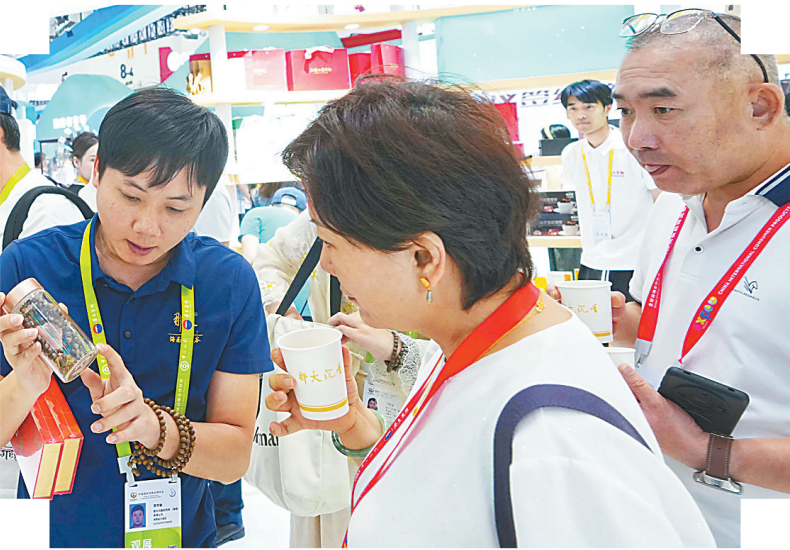
▲ 4月15日，在第五届中国国际消费品博览会海南馆，工作人员向观众介绍儋州特色展品。

近日，在第五届中国国际消费品博览会上，儋州80多款特色精品亮相，向全球客商展现产业发展成果及独特魅力。连续5年在消博会“露脸”，儋州继续借此平台推介“儋洋制造”，不断提升儋州品牌的影响力和竞争力。同时，儋州还抓住合作机遇，借助消博会扩大“儋洋朋友圈”。