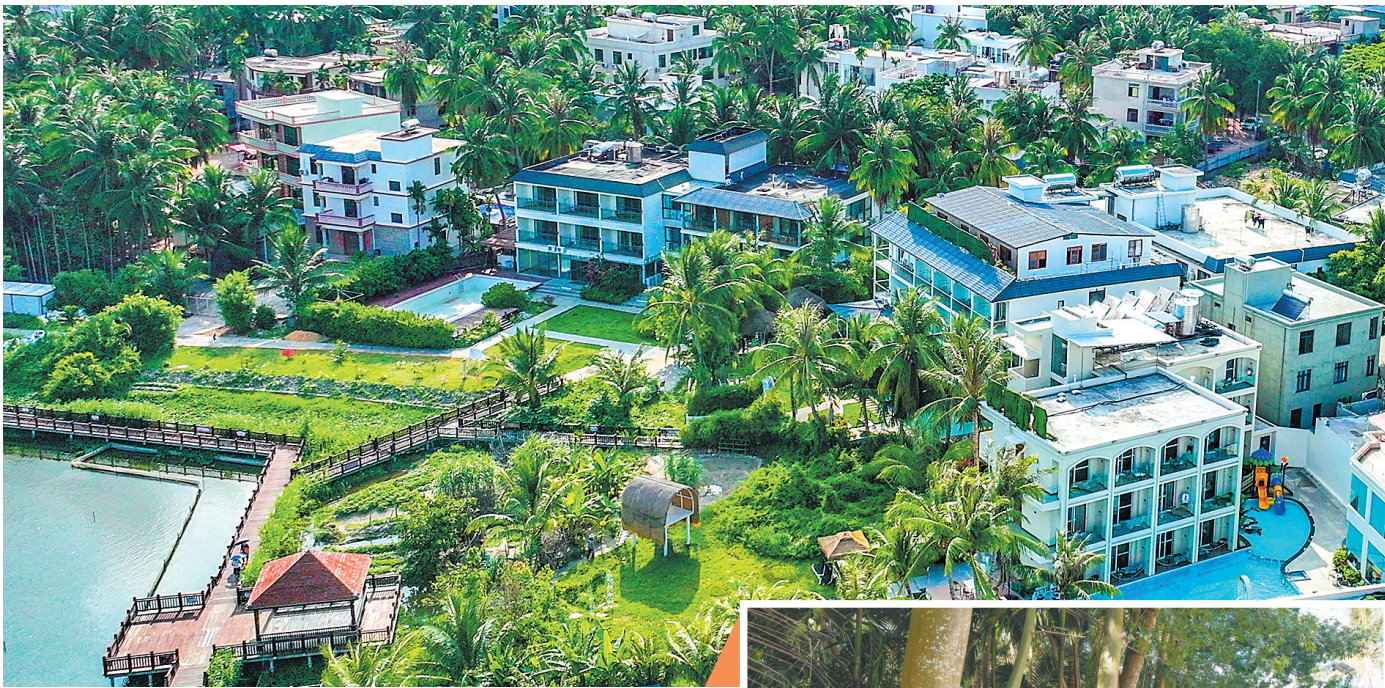
▲ 如今的三亚博后村,已成为名副其实的“民宿村”。 ► 启动美丽乡村建设之前的博后村。

4月20日,位于三亚博后村的玫瑰花花香四溢,2025年三亚玫瑰文化节刚刚闭幕,上万名国内外游客共赴“玫瑰之约”。 许多游客不知的是,早些年,博后村还是另一番景象:土地盐碱化严重,农作物难以生长,村民们守着微薄的收成,艰难维持生计。 转机出现在2013年。当年,习近平总书记来到博后村考察,提出“小康不小康,关键看老乡”的重要论述。 此后,博后村因地制宜,加大力度发展特色产业。在盐碱地改良的同时,相关企业也在玫瑰种植业基础上,打造出集玫瑰游览观光、二次加工于一体的产业链,不仅美化了乡村环境,还带动了村民就业增收。 随着三亚市委、市政府将博后村就地改造为5A级美丽乡村,村民们纷纷改造自家房屋,开办各具特色的民宿。民宿产业如雨后春笋般兴起,从最初的几家发展到如今的70余家,客房超2000间,2024年接待过夜游客约106万人次,实现营业收入1.5亿元。博后村已成为海南规模最大的民宿村之一。 村民们在家门口创业就业,收入多元化,日子越过越红火。从昔日的贫困落后到如今的幸福宜居,博后村的华丽转身,是海南深入实施乡村振兴战略的鲜活样板,也是村民们用勤劳双手创造美好生活的生动写照。 (本报三亚4月20日电)