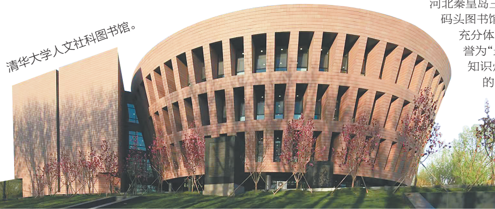
清华大学人文社科图书馆。

一些大学图书馆在特色资源建设方面展现出独特魅力。比如，清华大学图书馆的马克思恩格斯文献、联合国裁军资料、明清地方文书等馆藏已初具规模，有力支撑了相关学科的发展；北京大学图书馆的近5000种方志、2200余种家谱、多个小说戏曲专藏，以及胡适、季羨林、汤一介、俞大维等学者捐献的书籍。无论是研究者还是普通读者，都能从中找到启发与灵感，感受到知识的力量与魅力。