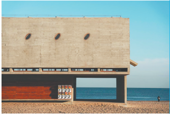
河北秦皇岛三联海边图书馆。本版图片均为资料图

4月23日是“世界读书日”，这一天提醒我们珍视书籍和图书馆在现代社会中的独特地位——不仅是知识的宝库，也是心灵得以栖息的地方。无论是融合了传统与现代元素的建筑杰作，还是藏书丰富的文化宝库，那些分布在全国各地的“最美图书馆”承载着深厚的文化底蕴和历史记忆，成为人们求知与探美的理想殿堂。