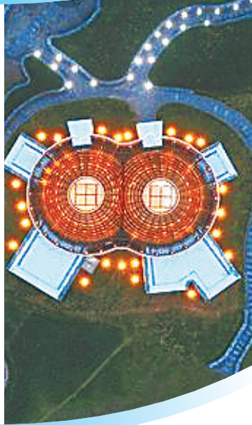
航拍河北承德木兰坊图书馆。

4月23日是“世界读书日”，这一天提醒我们珍视书籍和图书馆在现代社会中的独特地位——不仅是知识的宝库，也是心灵得以栖息的地方。无论是融合了传统与现代元素的建筑杰作，还是藏书丰富的文化宝库，那些分布在全国各地的“最美图书馆”承载着深厚的文化底蕴和历史记忆，成为人们求知与探美的理想殿堂。