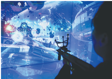
参观者在2025中国科幻大会“幻聚·多维宇宙”沉浸式科幻展中体验XR交互游戏。

在日前举行的2025中国科幻大会上,中国科幻研究中心发布《2025中国科幻产业报告》。2024年,中国科幻产业总营收达1089.6亿元,科幻阅读、科幻衍生品与科幻文旅板块原创能力凸显。科幻作为科技与文化融合的引擎,展现出跨界融合发展的巨大潜力。