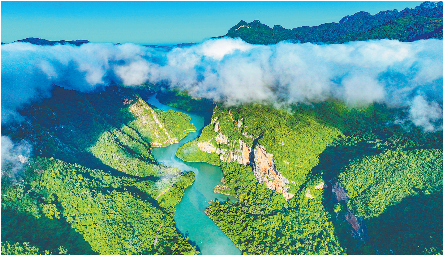
昌江王下乡十里画廊。