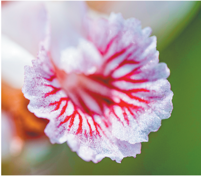
白沙青松乡南药益智花蕊绽放。

我们欣喜地看到，湿地面积不断增加，生物栖息地越来越宽广。我们能经常邂逅生机勃勃的“精灵”们，听大地上万物的独特欢歌——那是人与自然是和谐共生的“最美交响曲”。