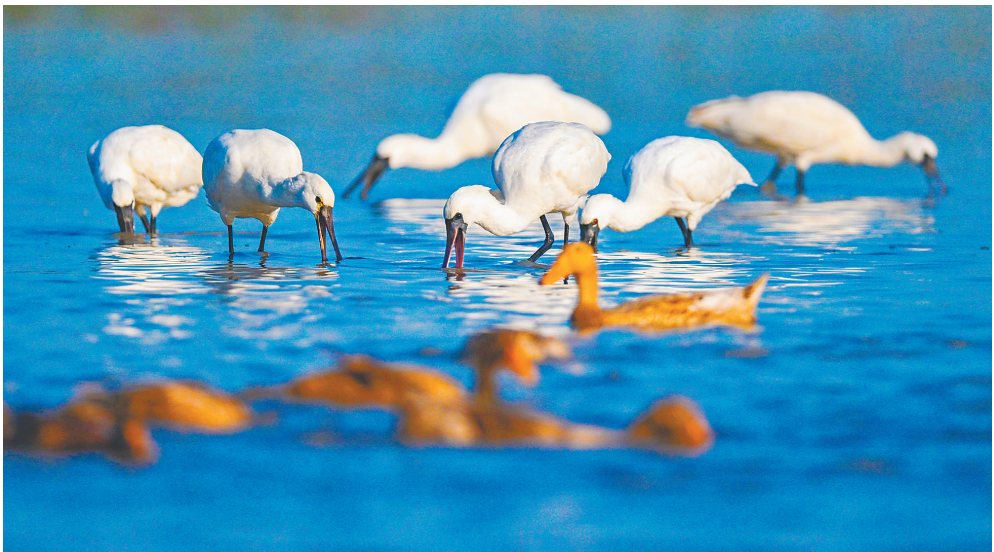
儋州新英湾的黑脸琵鹭。