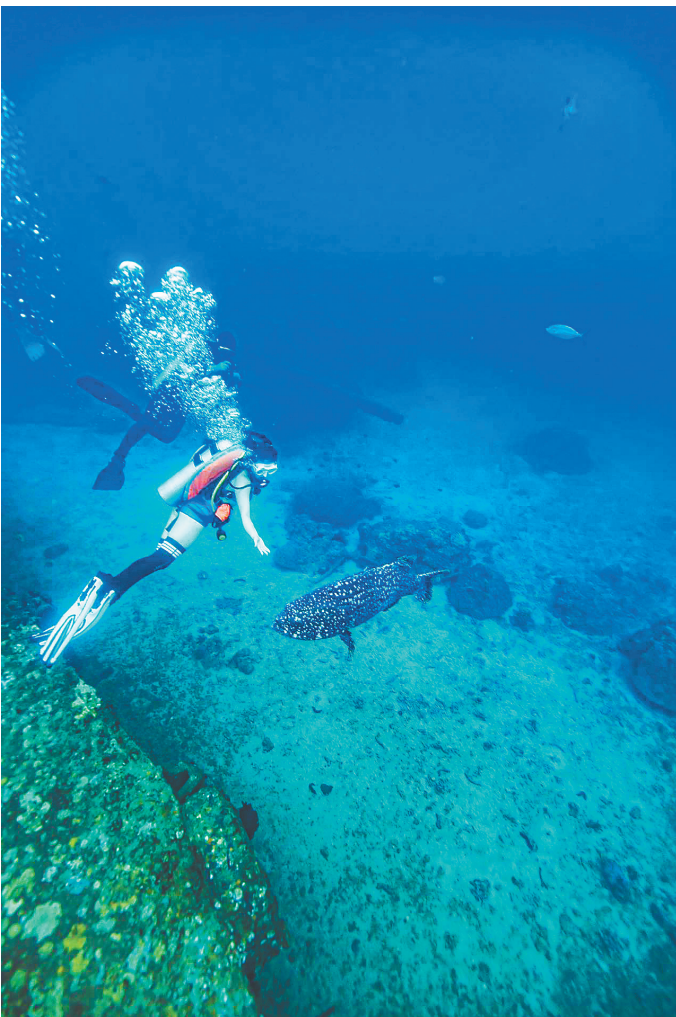
巨型石斑鱼在蜈支洲岛觅食。