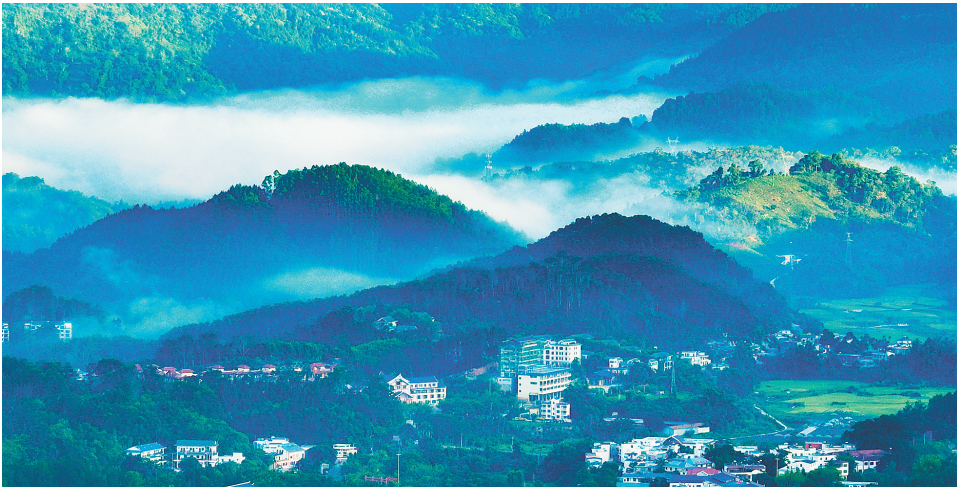
五指山水满乡。