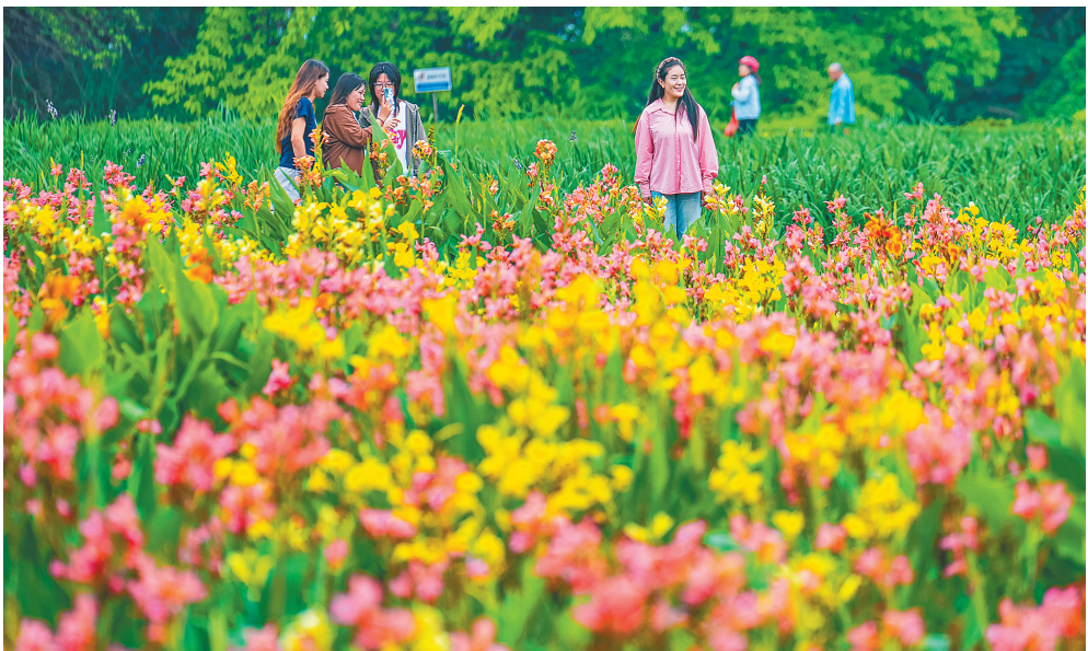
海口金牛湖人工湿地。

拂晓时分，一声声清亮的啼鸣，划破了霸王岭山野密林间的寂静。海南长臂猿在树冠间快速移动，穿梭在热带雨林之间。