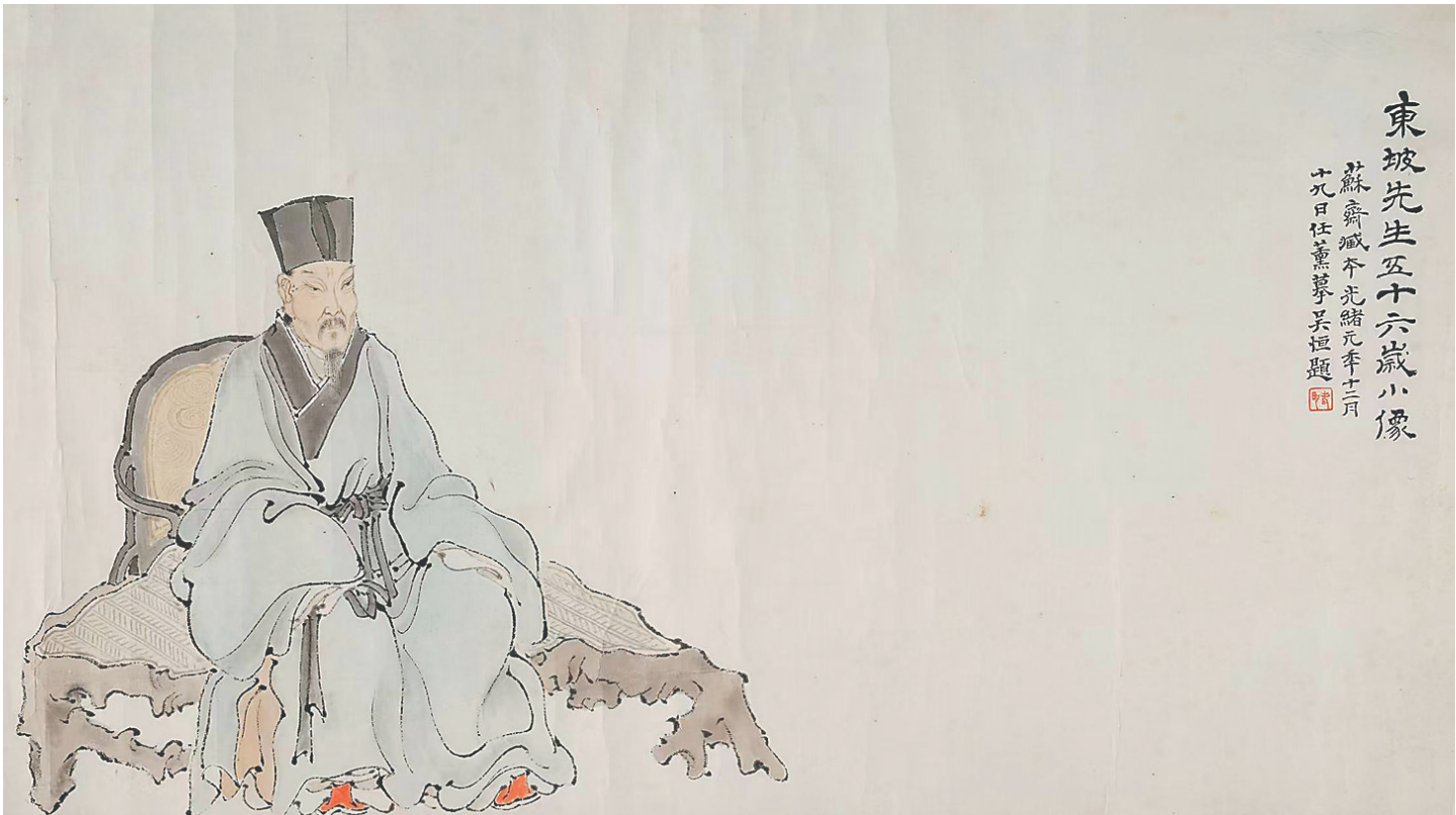
清光绪任薰摹《东坡先生五十六岁像》。

几乎与《居儋录》同时出现的还有《宋苏文忠公海外集》，后世也不断查缺补漏，诞生多个版本，清代的版本则以《苏文忠公海外集》之名行世，可称为《海外集》系列古籍。