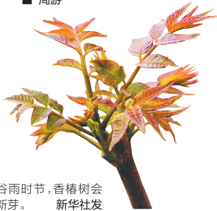
谷雨时节，香椿树会吐出新芽。

今年4月20日是谷雨节气，从这一天开始，白日渐长，气温渐升，江南已入雨季，北方雨水增多，空气潮湿，气压走低。此时，我们应当吃些什么呢？