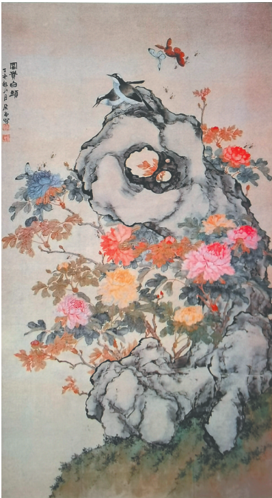
晚清居廉的《富贵白头图》。 北京故宫博物院藏