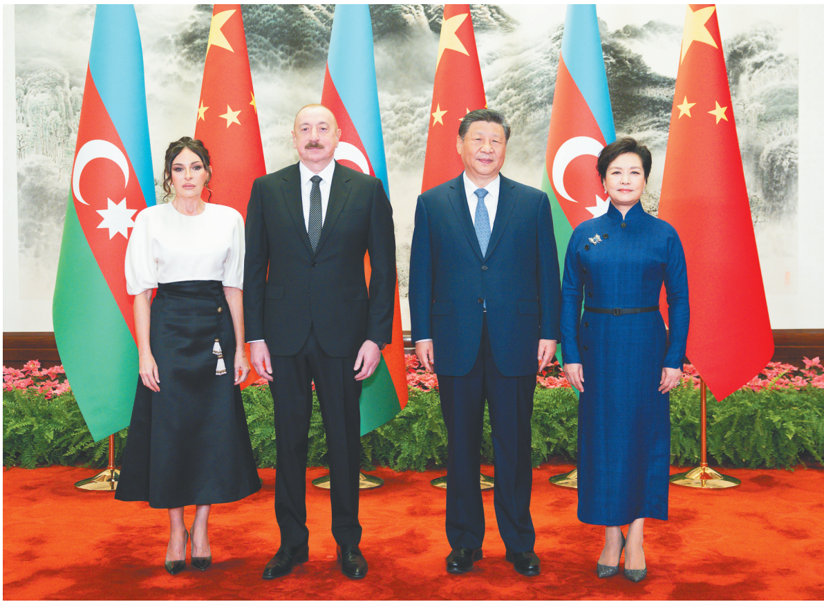
四月二十三日，国家主席习近平在北京人民大会堂同来华进行国事访问的阿塞拜疆总统阿利耶夫举行会谈。这是习近平和夫人彭丽媛同阿利耶夫和夫人阿利耶娃合影。